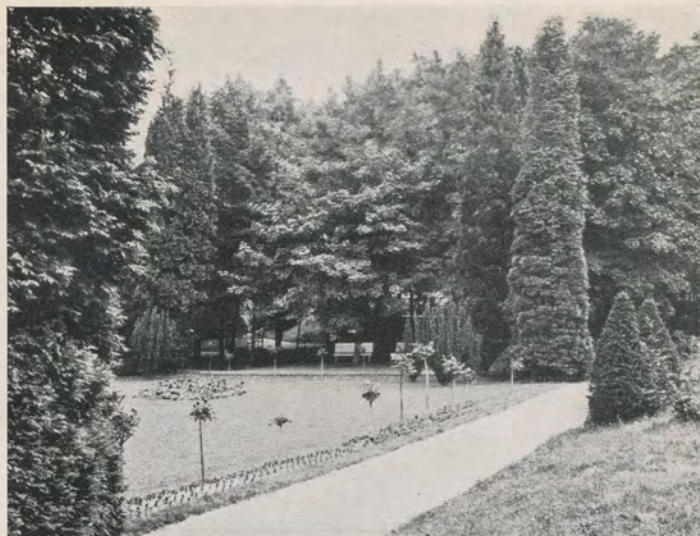
Teilansicht des Parkes