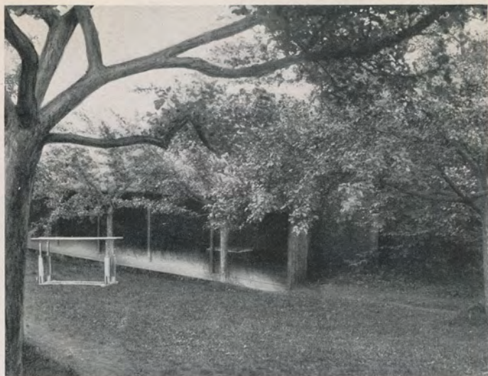
Teilansicht eines Luftbades

legenheit zu abwechslungsreichen Spaziergängen durch Park und Forst. Am Waldesrand entlang führt ein bequemer Promenadenweg mit herrlichem Fernblick zum Kurhaus, zum Wilhelmshöher Schloß und zu den Parkanlagen mit ihren berühmten Wasserkünsten und der romantischen Löwenburg. Der Herkules ist auf Gebirgspfaden oder in kurzer Straßenbahnfahrt erreichbar. — Im Winter bietet sich dem Sportfreunde hervorragendes Gelände (bis 650 m ü. d. M.) für Kodel und Ski mit mehr oder weniger gestreckten Abfahrten (Kodelbahn, Übungshügel, Sprungschanze).